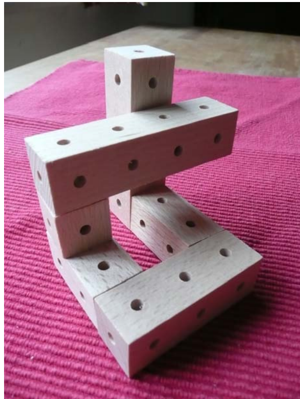
Abb. 2 Bauwerk 2

2. Zeichne nun mit Bleistift wie in der Abbildung 4 in dein Arbeitsheft jeweils 3 zusammenhängende Ansichten der Bauwerke 1 und 2